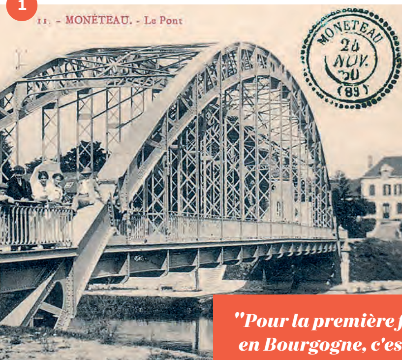
11. - MONÉTEAU. - Le Pont

"Pour la première fois en Bourgogne, c'est à Monéteau que ça se passe"